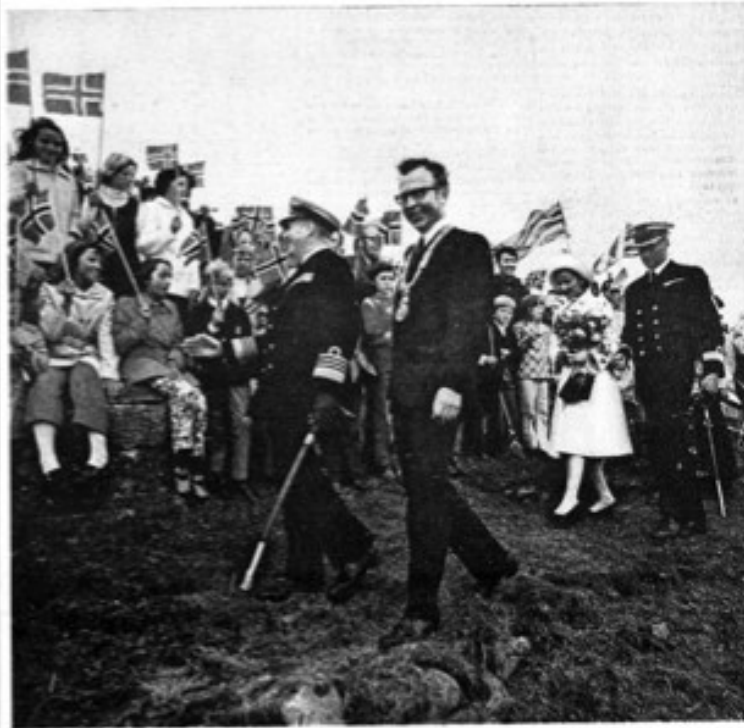
Kong Olav, prinsesse Astrid og prinsesse Beate på ekspedisjon til Froland i forbindelse med stiftelsen av et nytt museum i Froland. De er omgitt av mange mennesker.