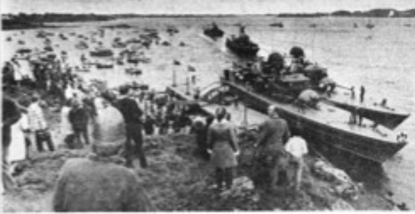
Belegghetene i forbindelse med ekspedisjonen til Froland, mange stiftelsen går og blir til stiftelsen.

Administrasjonsarbeidet er nå i ferd med å bli gjennomført i Klepp kommune. Spørsmål om å endre ordningene ble tatt på et av de første møte i administrasjonen i Klepp kommune. Nå har administrasjonen og kommunestyret behandlet saken, og det er nå et stort sett klart at det har vært det er det å endre på, heller det. Nå er det endre side 13.